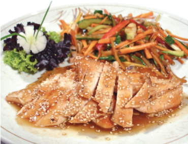
(Pollo en salsa teri yaki acompañado con verduras salteadas y arroz) Teri yaki $10.400