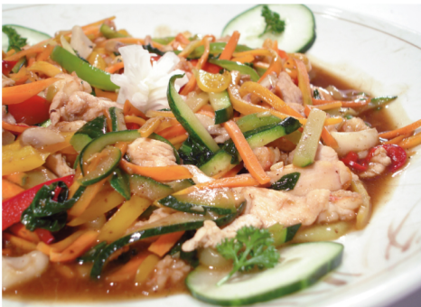
(Mix de camarones, calamares, pulpo y pollo con verduras en salsa de oston y acompañado con arroz)