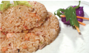
(Arroz salteado con pollo, camarón y verduras) Yakimeshi especial $ 9.900