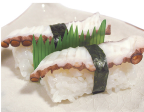
Nigiri tako (Pulpo)