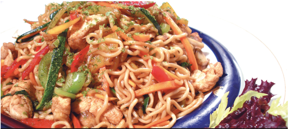
(Fideos yaki soba con pollo y verdura salteadas)