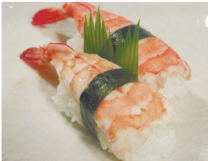
Nigiri ebi (Camarón)