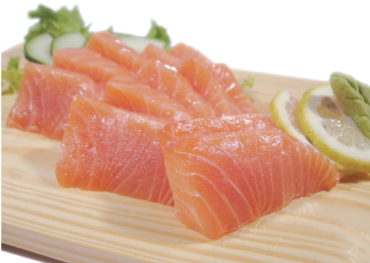
Sashimi de Salmón