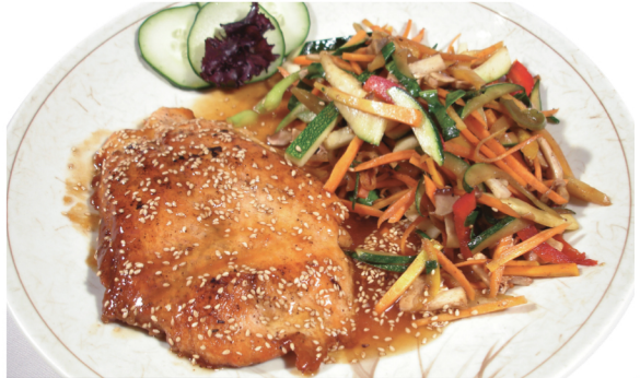
(Salmón con salsa teri yaki acompañado con verduras salteadas y arroz) Sake yaki $ 11.400