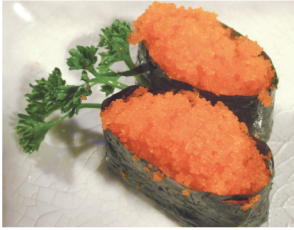
Nigiri Masago (Huevo de pescado)