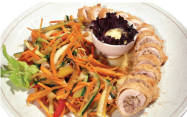
(Rollito de pollo relleno con nueces, acompañado con verduras salteadas y arroz) Kuru miyage $10.400