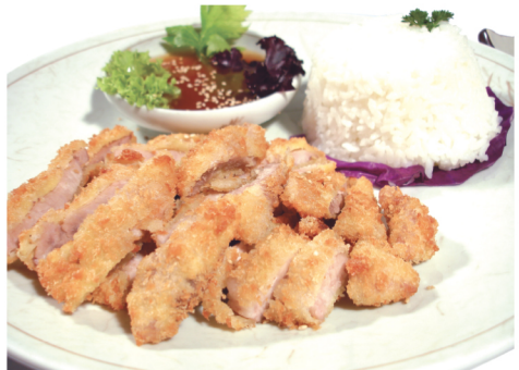
(Cerdo apanado con salsa katsu, acompañado con arroz y verduras)