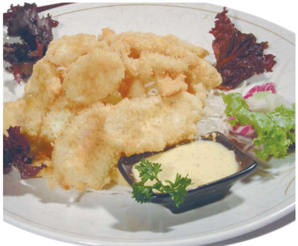
(Calamares apanados con salsa katsu) Ika furay $ 9.900